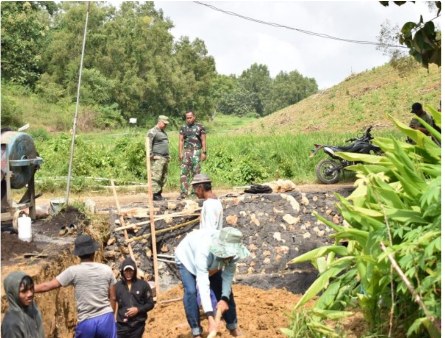
Dansatgas TMMD 127 melihat progres pembuatan TPT didampingi Lettu Arh Kumam di desa mandala

SUMENEP - Komandan Satuan Tugas (Dansatgas) TNI Manunggal Membangun Desa (TMMD) ke-127 Tahun Anggaran 2026 Kodim 0827/Sumenep, Letkol Arm Bendi Wibisono, S.E., M.Han, meninjau langsung progres pembangunan di Desa Mandala, Kecamatan Rubaru, Kabupaten Sumenep, Senin (16/2/2026).